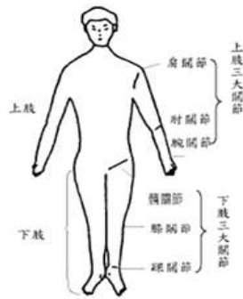
(2) 上、下肢關節生理運動範圍一覽表